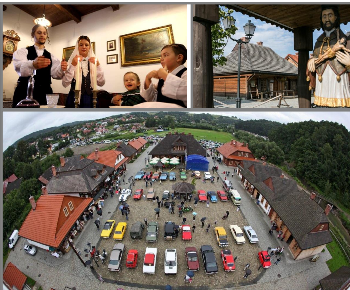
Zdjęcia: Mieszkanie żydowskiego krawca – szabas; Wernisaz wystawy; Złot zabytkowych pojazdów.

Miasteczko Galicyjskie jest rekonstrukcją XIX wiecznej zabudowy małomiasteczkowej charakterystycznej dla regionu Sądeckiego. Przestrzeń została zaaranżowana jako aktywne centrum kulturalne, działające na zasadzie „żywego organizmu” – aranżacja budynków i realizowanych w nich pokazów daje zwiedzającym możliwość „zabawy z historią” dopełniając tym samym dominujące funkcje poznawcze i edukacyjne. Walorem konserwatorskim projektu jest wykorzystanie zachowanej wiedzy do odtworzenia dawnych budynków, które uległy zniszczeniu.