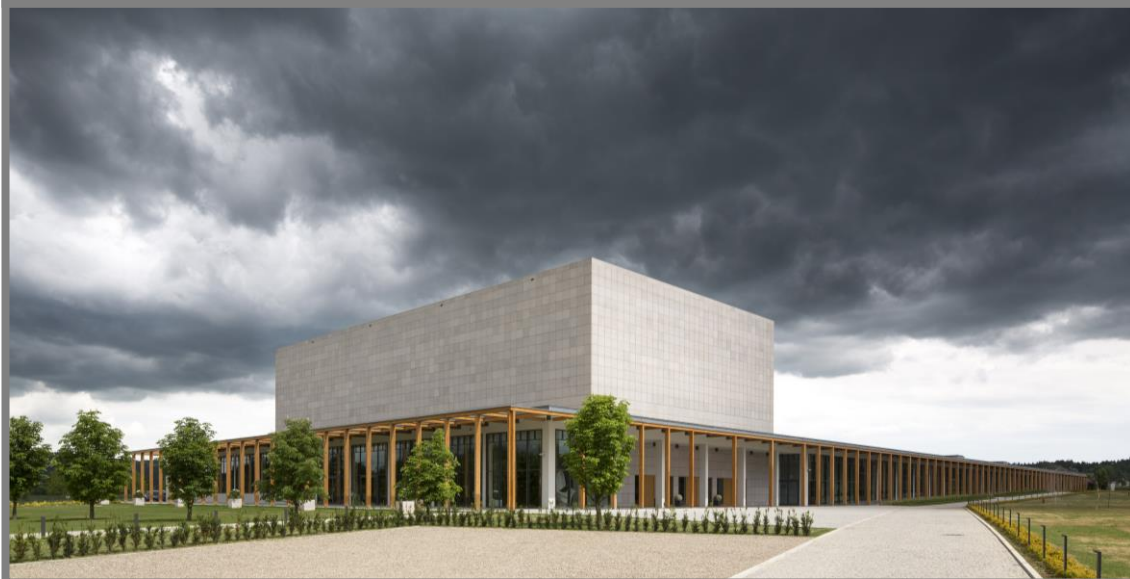
Zdjęcia: Lutostawska Orkiestra Talentów, Uroczysta inauguracja Centrum, Budynek ECM.