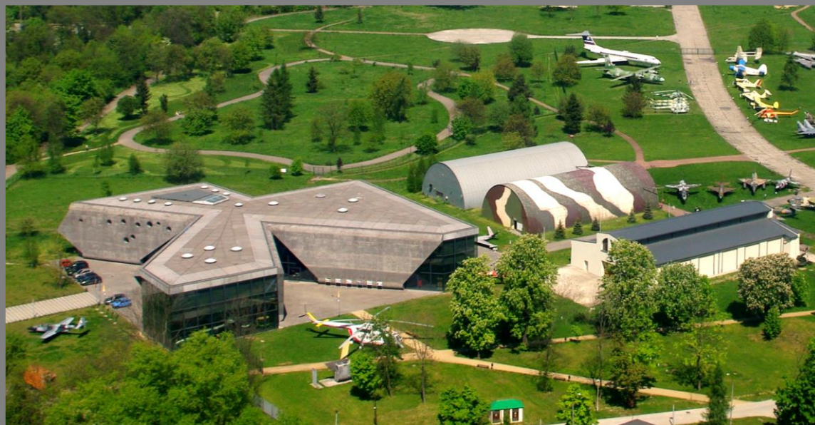
Zdjęcia: „Hesja”; Noc Muzeów.; Kompleks budynków MLP.