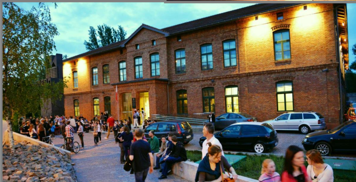
Zdjęcia: Fragment ekspozycji podczas zwiedzania z przewodnikiem; Siedziba Muzeum AK; Działalność Muzeum AK – Noc Muzeów 2013.