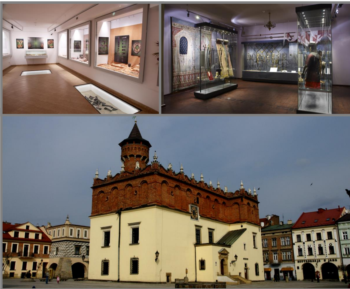
Zdjęcia: Zbrojownia oraz Fragment ekspozycji stałej. Ratusz w Tarnowie.

W pierwszym etapie przeprowadzono prace rewaloryzacyjne i modernizacyjne Ratusza i Spichlerza. Przy zastosowaniu nowoczesnych technologii ekspozycji zmodernizowano wystawę stałą oraz wprowadzono interaktywne formy udostępniania zbiorów muzealnych. W drugim etapie dokonano kompleksowego remontu i rozbudowy kamienicy przy Rynku 3. W budynku zorganizowano: sale ekspozycyjne, pomieszczenia biurowe i recepcyjne, bibliotekę, magazyny i pracownie konserwatorskie.