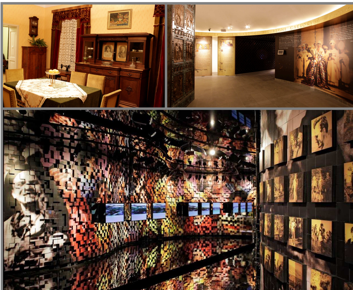
Zdjęcia: Nowa ekspozycja.

Założeniem projektu była budowa nowoczesnego muzeum narracyjnego, opartego na multimedialnej i interaktywnej ekspozycji łączącej w harmonijny sposób historię i nowoczesność. Efektem realizacji projektu jest stworzenie przestrzeni dla realizacji nowych inicjatyw kulturalnych, obywatelskich, narodowych i europejskich o wymiarze uniwersalnym. Zakres rzeczowy zadania obejmuje wykonanie prac budowlanych, adaptacyjnych oraz wyposażenie budynku i wystawy.