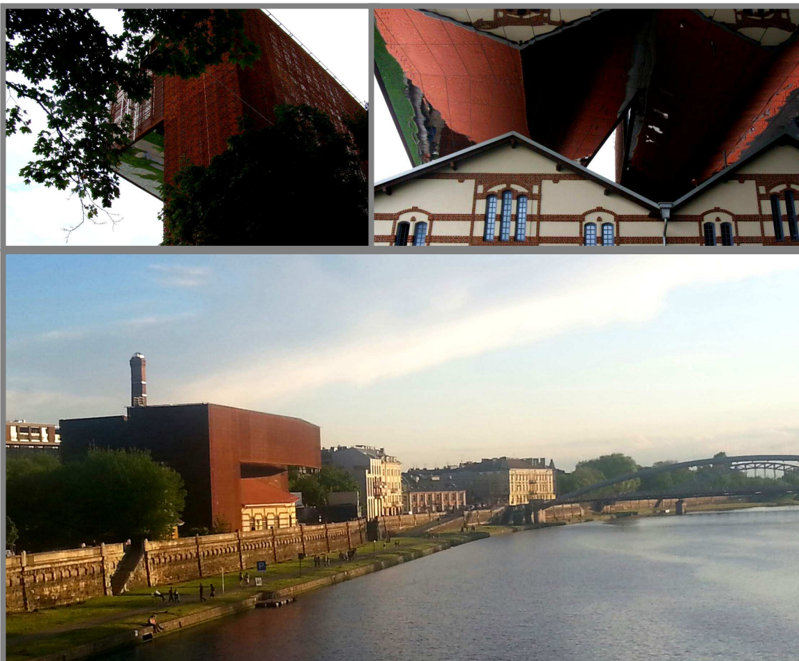
Zdjęcia: Pylon Zachodni oraz Dachy Cricoteki. Muzeum Kantora.

Nowoczesna budowla z betonu i stali – gmach w formie mostu przerzuconego nad zabytkową elektrownią – ma wyróżniać architektonicznie miejsce lokalizacji obiektu i przyciągać uwagę, dając nowoczesną przeciwwagę dla historycznej zabudowy miasta.